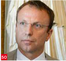
50 FRANCESCO VENTURINI Ceo, Enel Green Power