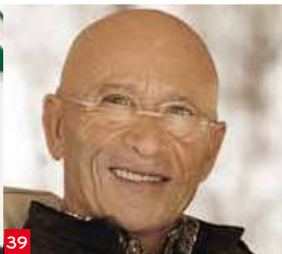
39 PASQUALE NATUZZI Presidente e ceo, Natuzzi