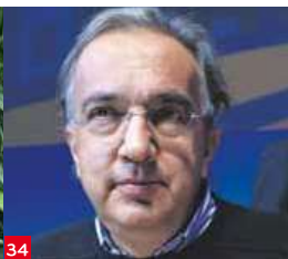
34 SERGIO MARCHIONNE Ceo, FCA e presidente Ferrari