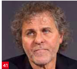
41 RENZO ROSSO Presidente, Otb